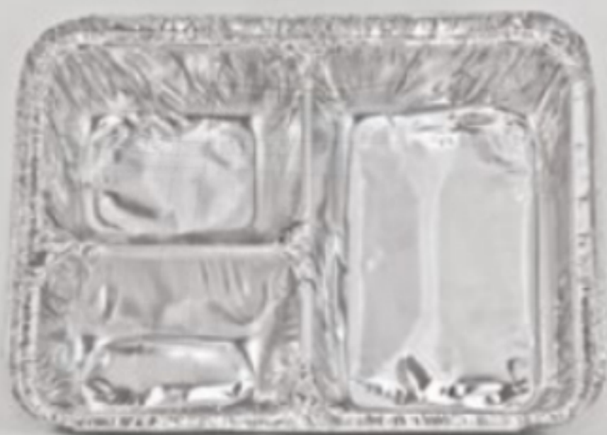
Bandeja 3 Divisórias T