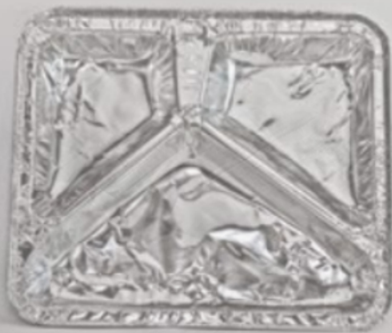
Bandeja 3 Divisórias Y