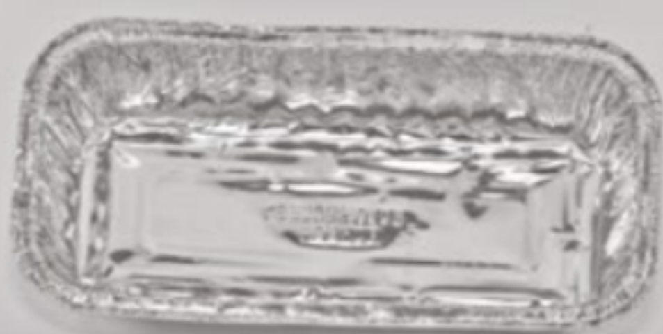
Bandeja Bolo Inglês